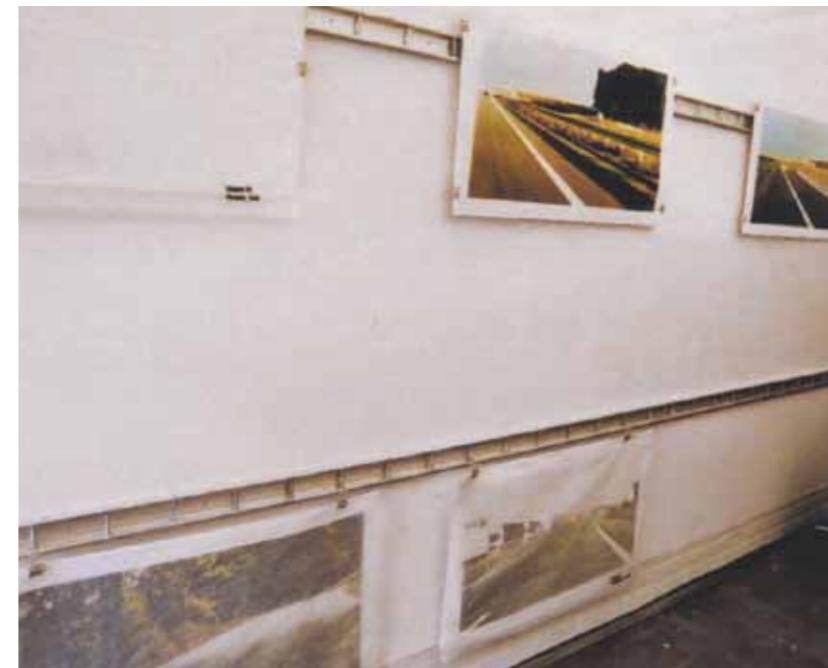
Mona Babl Landschaft erfahren

Beim Autofahren werden die Sinne auf das Visuelle reduziert, die erfahrene Landschaft wird zum Bild, zur flächigen zweidimensionalen Abbildung. Die einzelnen Etappen der Fahrt werden aus dem Auto heraus ausschnittsweise dokumentiert. Das Auto gibt dabei die Bildausschnitte vor und fungiert als Apparat zur Landschaftsbetrachtung. Die präsentierten Fotos werden bei jedem Halt ausgetauscht und jeweils die zuletzt erfahrenen Landschaften der Strecke werden gezeigt. Durch ein zweites Abfotografieren im Studio werden die Fotografien grobkörnig und unscharf. Sie erinnern an die Ästhetik von Autowerbung und sind offensichtlich Reproduktionen, keine sinnlich erfahrenen Eindrücke, sondern rein visuell erfahrene Abbildungen.