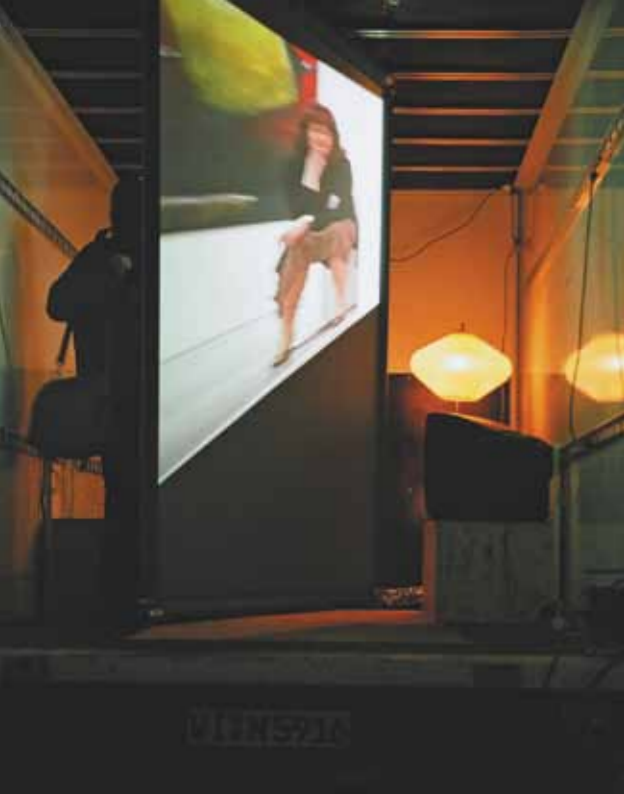
Christine Berndt Flimmerkiste

Die Arbeit "Flimmerkiste" inszeniert den mobilen Ausstellungsraum als fahrendes Kino. Eine drehbare Großleinwand im Eingangsbereich der Ladefläche dient als Eingangstür und transparente Grenzfläche zwischen Innen- und Außenraum. Die projizierten Videoarbeiten ohne Ton laden den Besucher in das Innere des Raumes ein, aus dem ein Sound zu hören ist, der weiteren Videoarbeiten, die im Innenraum auf einem Monitor gezeigt werden, zuzuordnen ist. Zwei Matten als Sitzgelegenheit, zwei Kisten zur Aufbewahrung der Technik, ein Monitor, ein Teppich und eine Stehlampe werden zu Requisiten des fahrenden Kinos. Je nach Situation wird man den geöffneten LKW-Innenraum als eine von außen zu betrachtende Flimmerkiste sehen oder aber als transitorischen Raum für Gespräche nutzen.