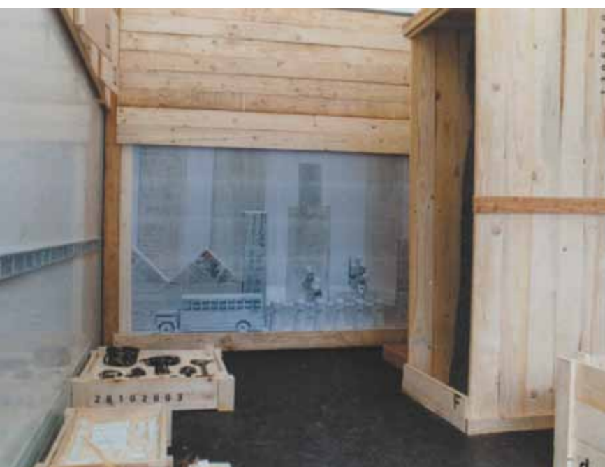
Anja Sonnenburg Frachtgut

Der LKW UND transportiert zwischen Berlin und Łódz ein Frachtgut. In Holzkisten verpackte, modifizierte und chiffrierte Spielzeuge erzeugen Bilder aus dem Gedankenlexikon des Krieges und verweisen in ihrer Widersprüchlichkeit auf die gemeinsame Geschichte beider Städte.