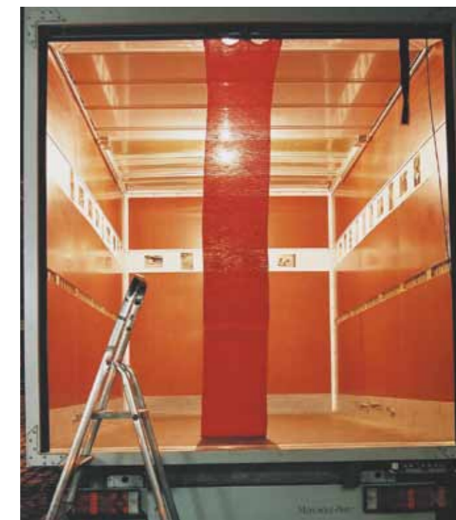
Won-Yeon Chung Der rote Faden

In meinem Wagen sind Fotos und ein roter, langer Schal zu sehen. Sie sind aus einer Aktion entstanden. An einem Tag im Juni 2004 habe ich einen roten Faden gezogen, von dort, wo ich wohne bis dahin, wo er, den ich liebe, gewohnt hat. Die Aktion dauerte 4 Stunden. Die Strecke betrug 1,5 km. Aus diesem 1,5 km langen Faden habe ich einen Schal gestrickt. Ich bin eine Ausländerin in Deutschland und habe relativ viel Kontakt zu meinen Landsleuten. Sie bleiben vorübergehend in Deutschland und irgendwann verschwinden sie wieder, so als wenn es eine Lüge wäre, dass sie jemals dort waren. Dabei dachte ich darüber nach, was Beziehung heißt und wollte unsichtbare Beziehungen fangen und visualisieren. Bei der Aktion „Roter Faden“ ist ER eine repräsentative Person, die ich kenne und die nicht mehr da ist: ER kann Sie sein. Oder ein Ereignis oder ein Objekt.