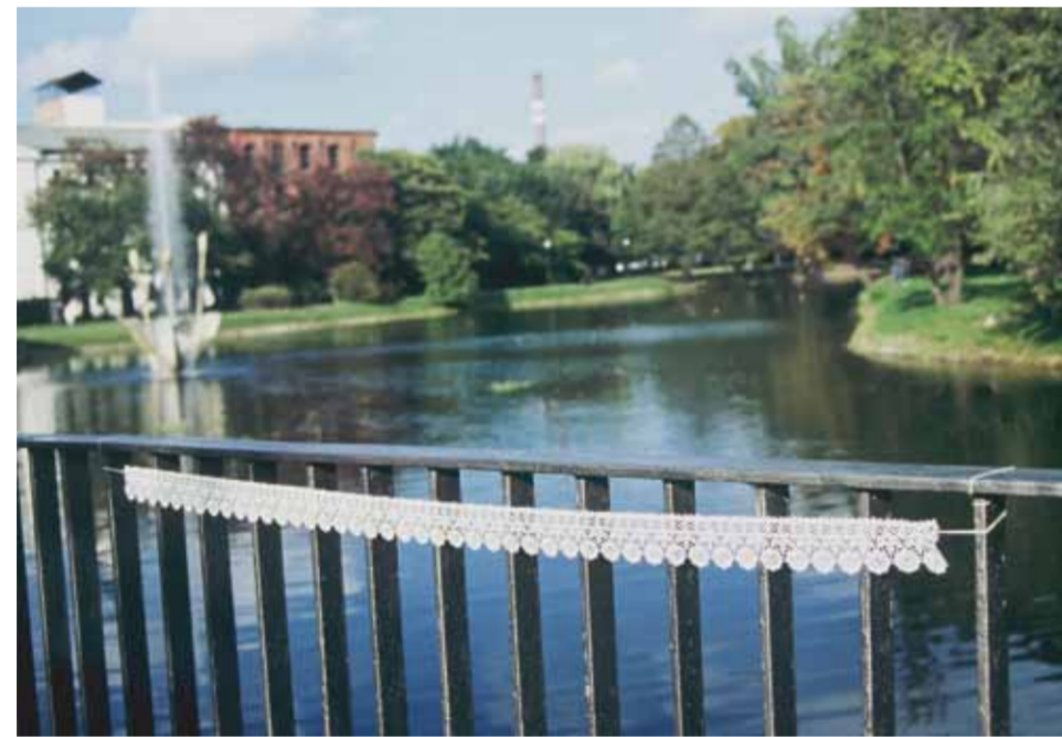
Kati Gausmann zwischen

Mein LKW "zwischen" transportiert ein textiles Lager: Schnüre, Bänder, Borten, Spitzen, Decken... Im Umfeld unserer Stationen hinterlasse ich sie an und auf Parkbänken, Zäunen, Brückengeländern... Bisweilen werden ihre Befestigungen gelöst und das Textil mitgenommen.